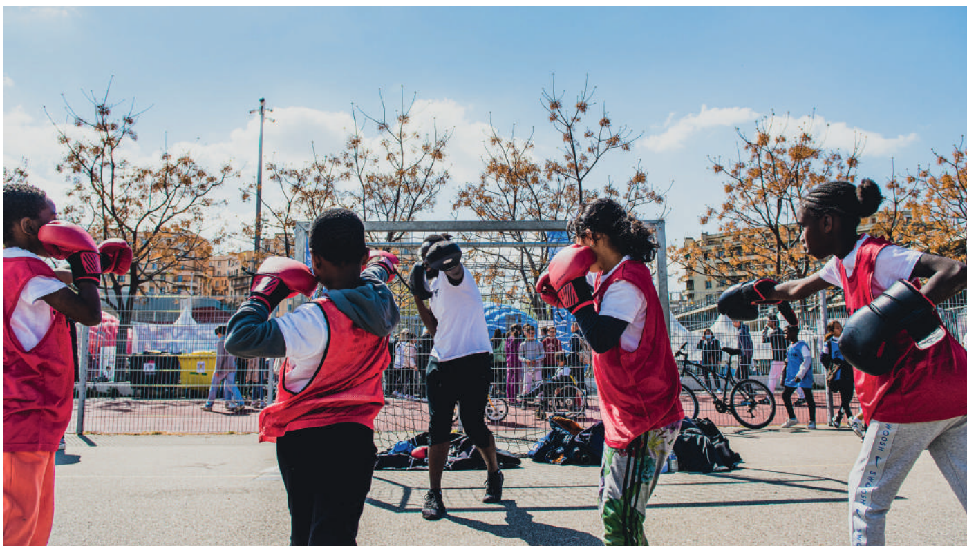
Dispositif « Tremplin Sport » Activités gratuites pour les petites Marseillaises et petits Marseillais