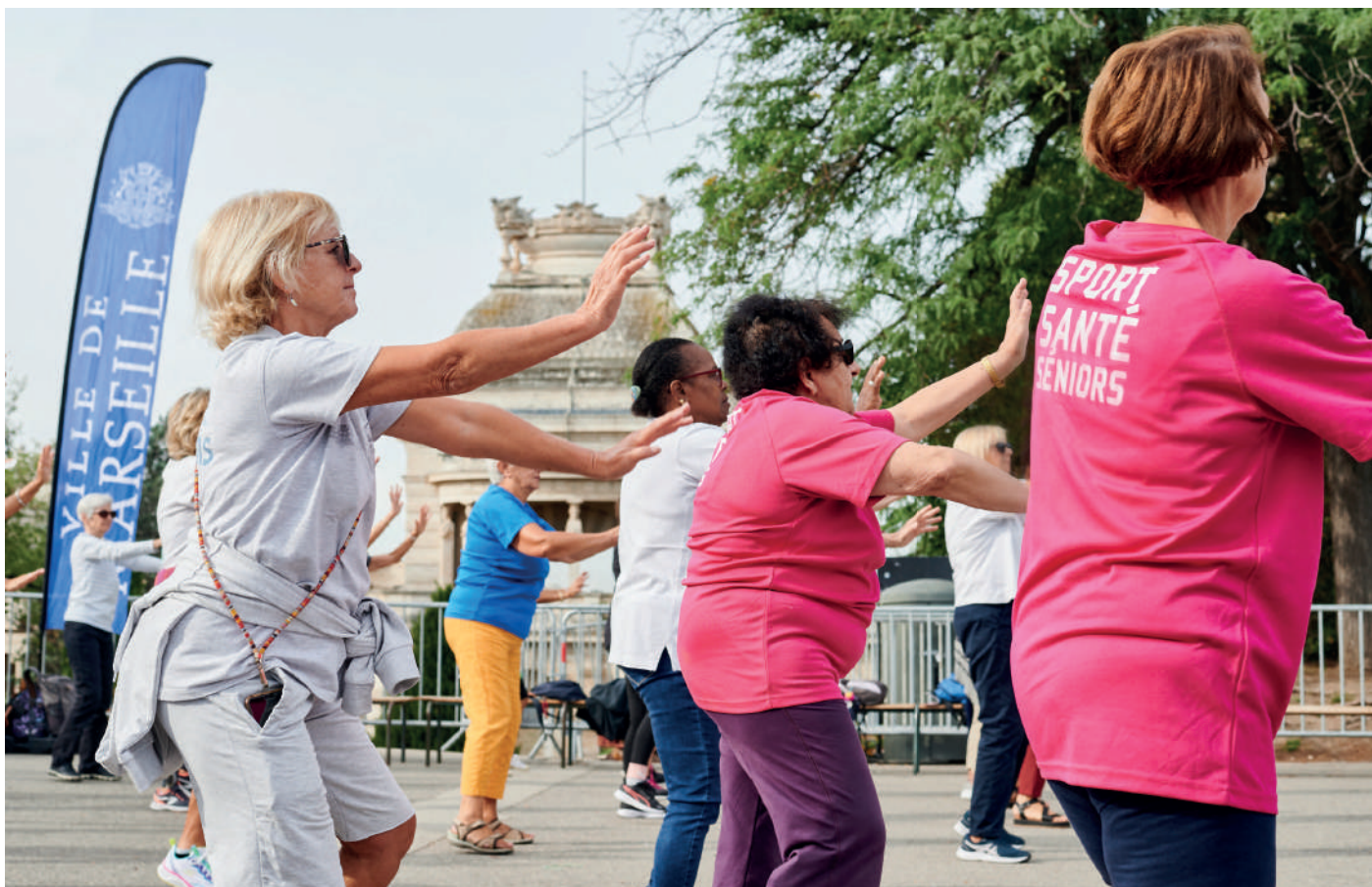
« Sport Santé Séniors » séances gratuites pour le bien-être de nos séniors