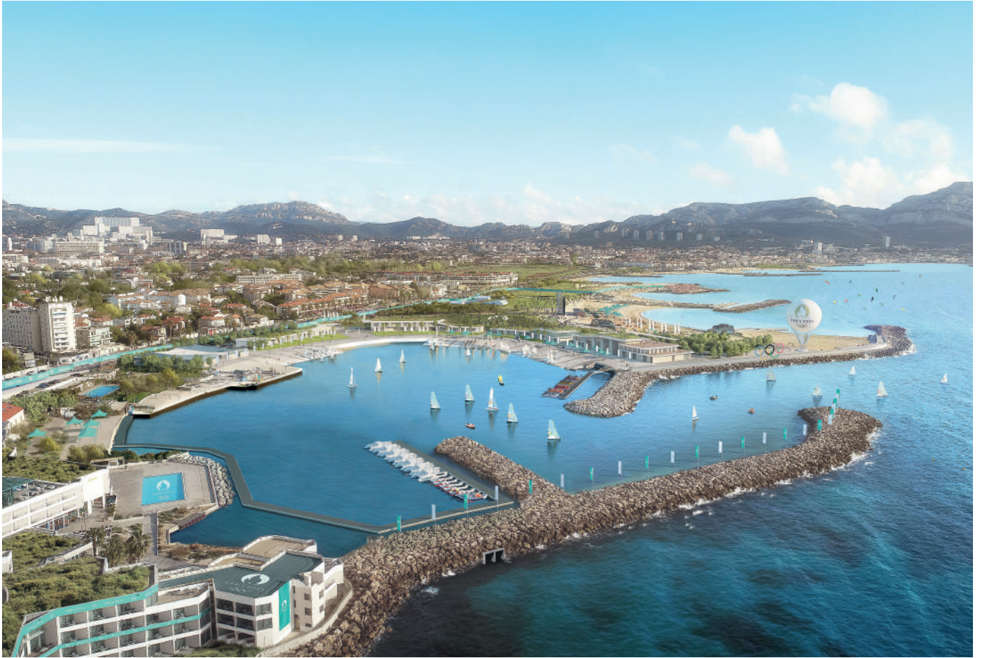
La Marina Olympique