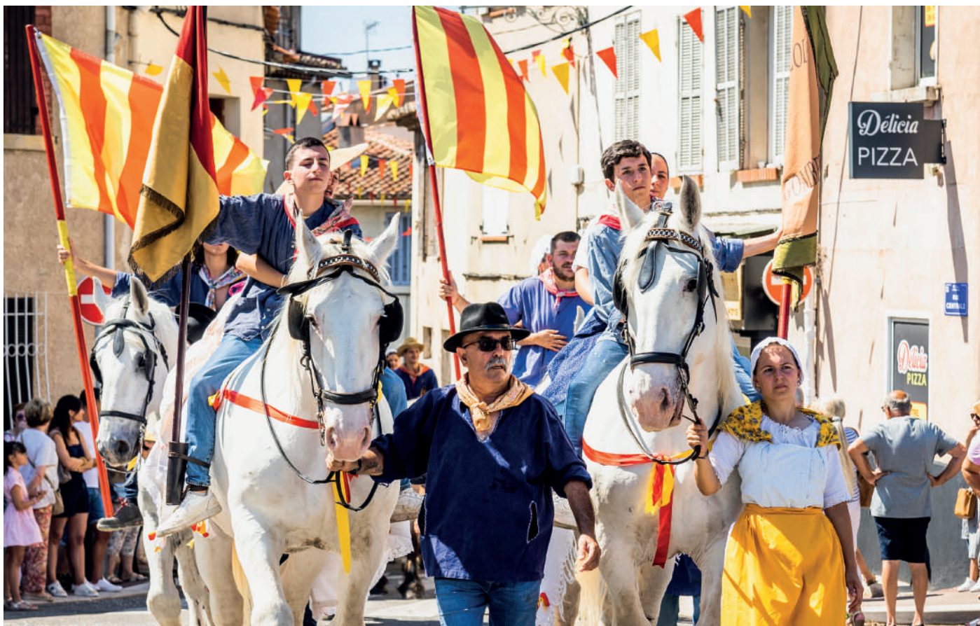
La fête de la Saint-Éloi