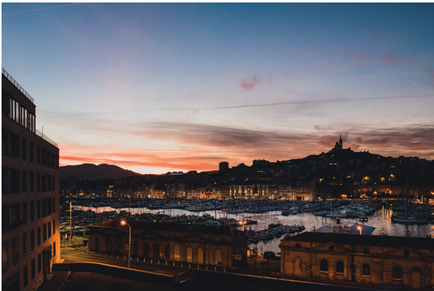
Marseille, bientôt la nuit