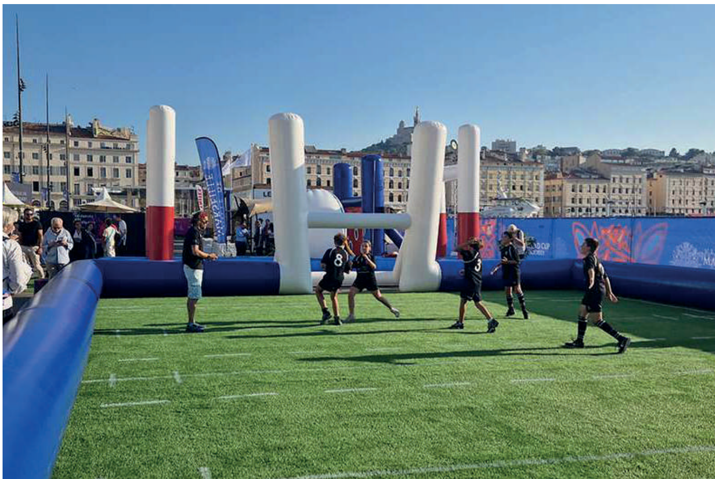
Village Rugby - Vieux-Port