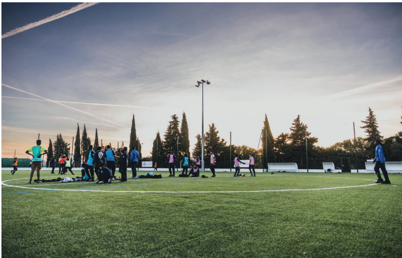
Inauguration du stade Canet-Floride « Marseille, ville active et sportive »