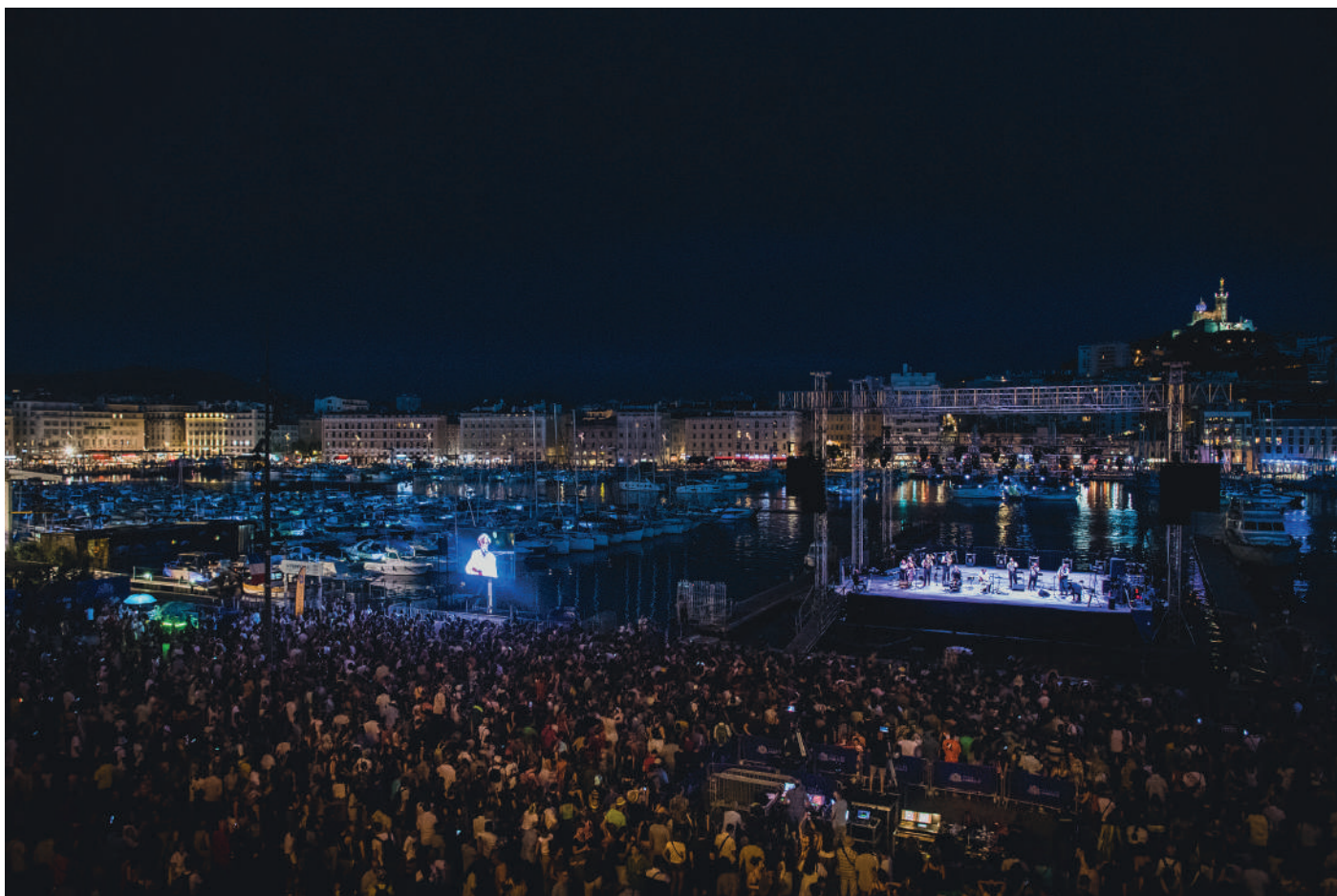
Spectacle « Room With a View » (LA) HORDE x RONE avec le Ballet National de Marseille - L'ÉTÉ MARSEILLAIS - Scène sur l'eau, Hôtel de Ville