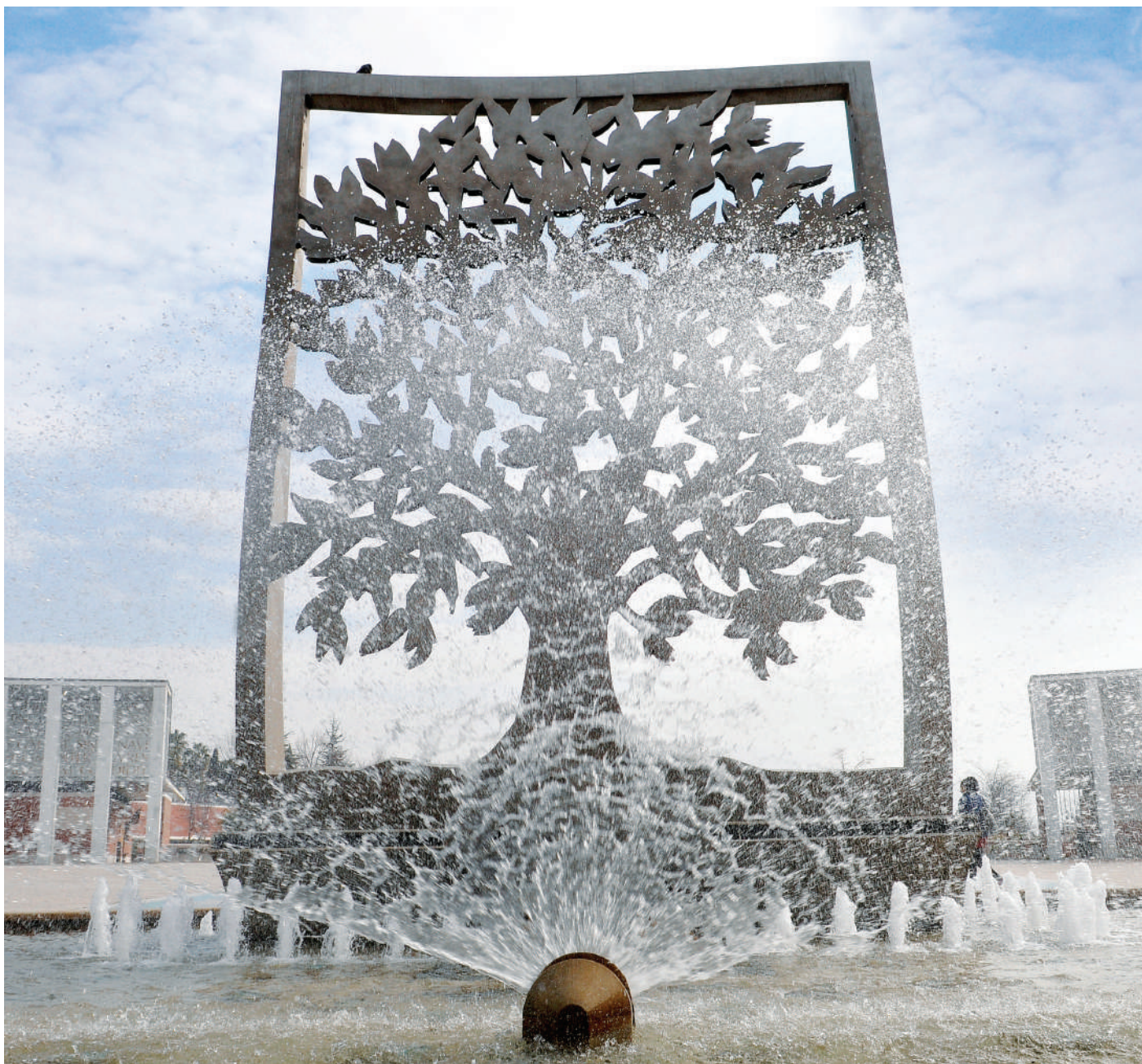
L'arbre de l'Espérance - « Parc du 26e centenaire »