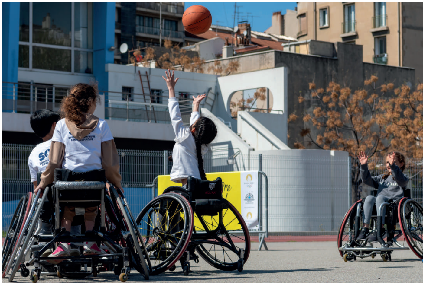
« Marseille vibre pour les Jeux » Semaine Olympique et Paralympique