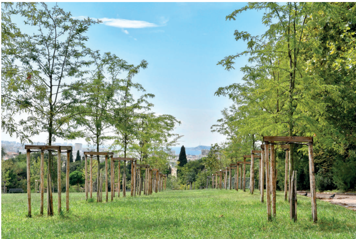
Parc de Font Obscure