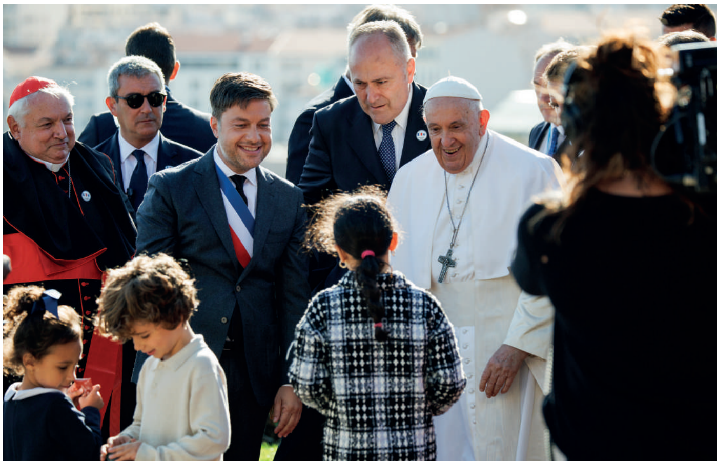
Les petites Marseillaises et petits Marseillais accueillent le Pape François