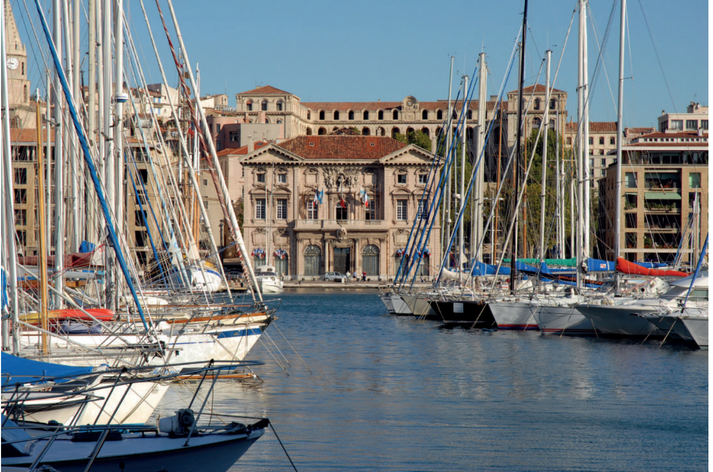
Vue de l'hôtel de Ville de Marseille