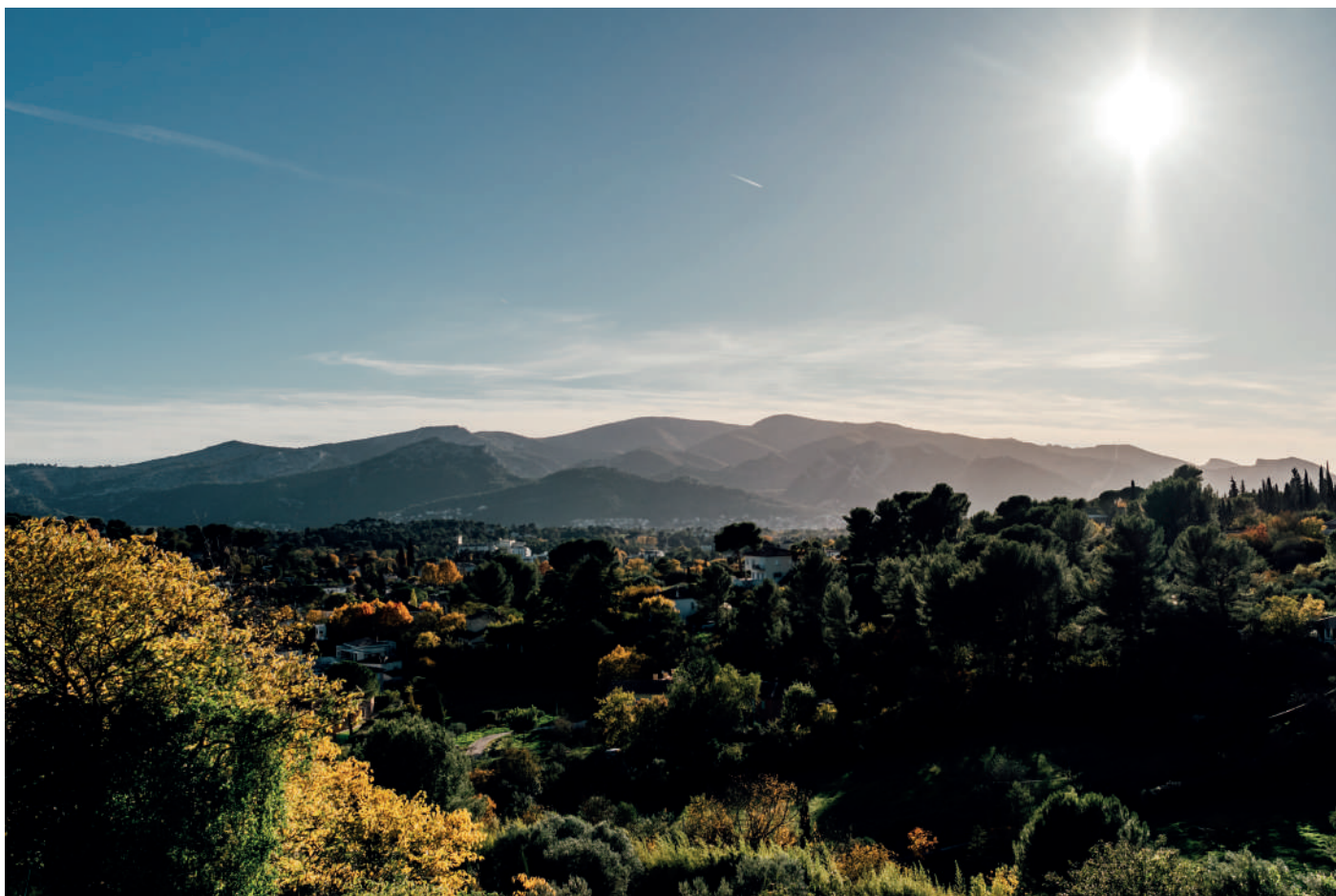
Vue du quartier de la Treille