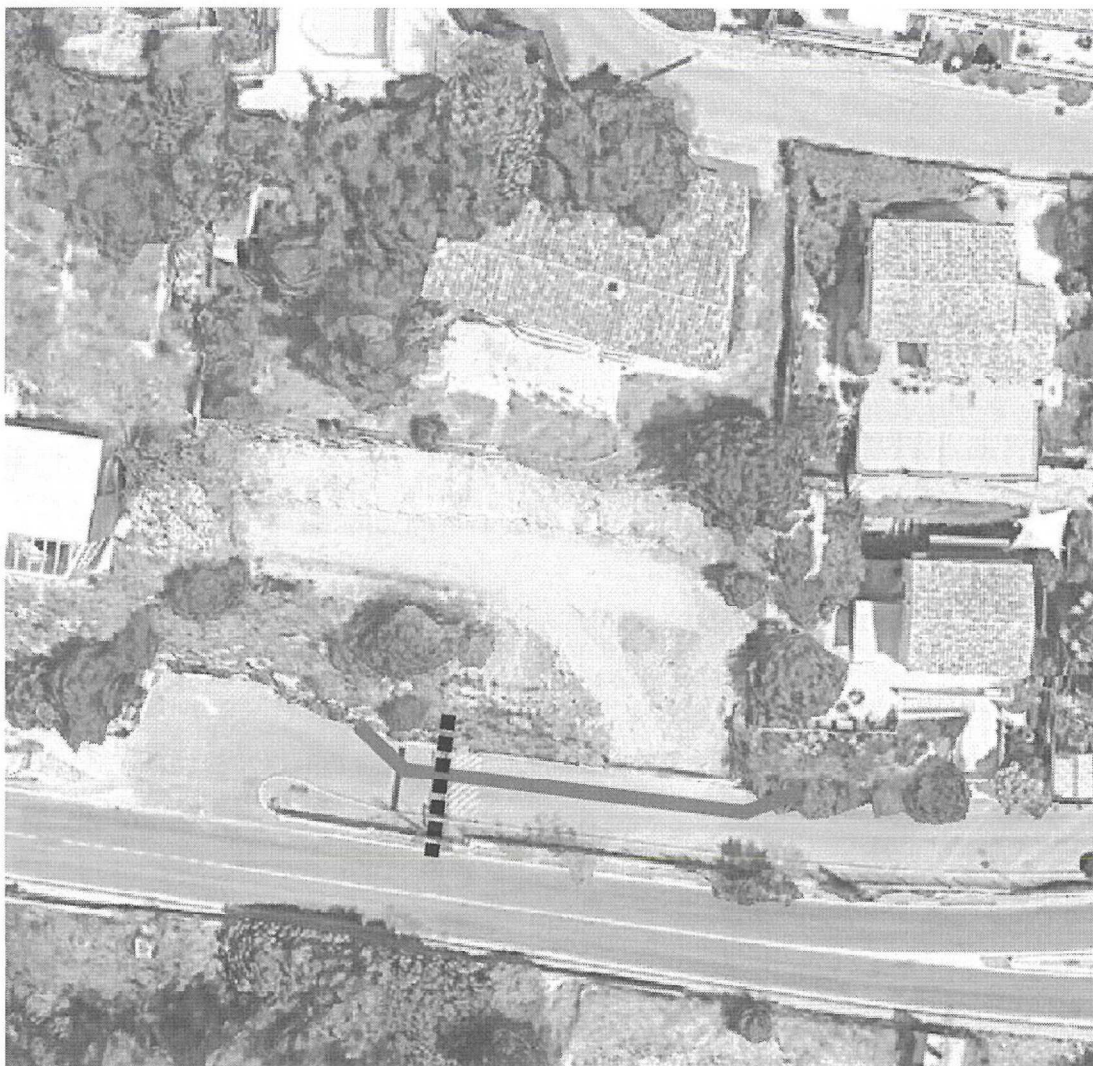
ROUTE DE LA VALENTINE

————— Périimètre de sécurité permettant le passage de véhicules